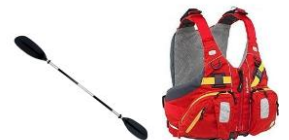
Material obligatori que es facilita amb la inscripció